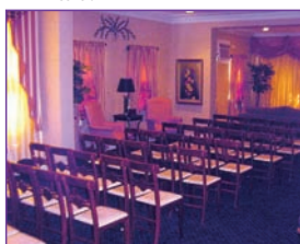
Capilla amplia y confortable