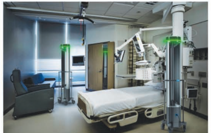
Para combatir el COVID-19 Trinitas ha adquirido dos unidades "Surfacide" de rayos ultravioletas que automáticamente desinfectan todas las superficies de la habitación donde el paciente recibe tratamiento.