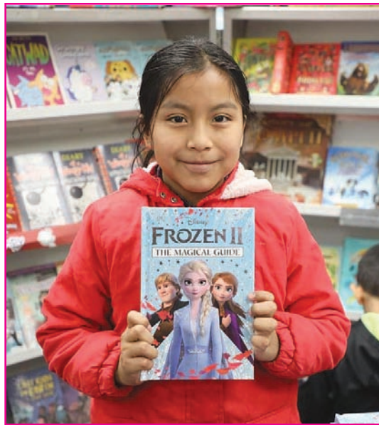
Estudiante de la Evergreen School muestra su libro preferido. Frozen II.

Más de 6,000 productos que incluyen libros galardonados, bestsellers, sets de libros en caja y mucho más estarán disponibles en línea. Los títulos de los libros incluyen los títulos favoritos de los niños para los grados Pre-K hasta la secundaria y más. Títulos como: Dog Man (Hombre de los perros), Raise a Reader Collections (Colección de libros sobre como criar a